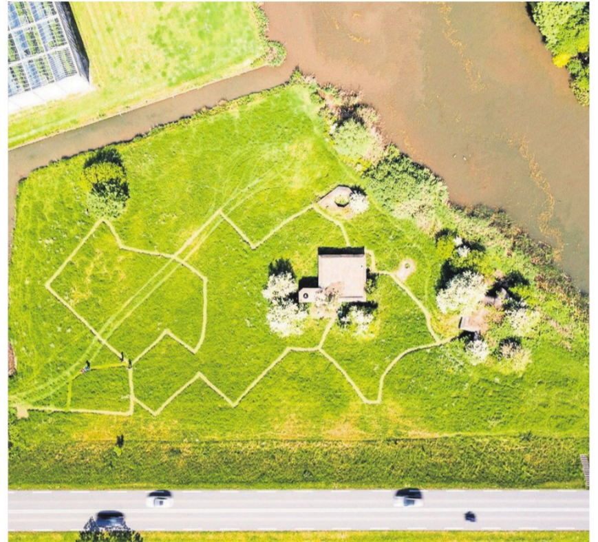
▲ De Stelling 34 langs de Maasdijk met de gemaaide 'loopgraven'.