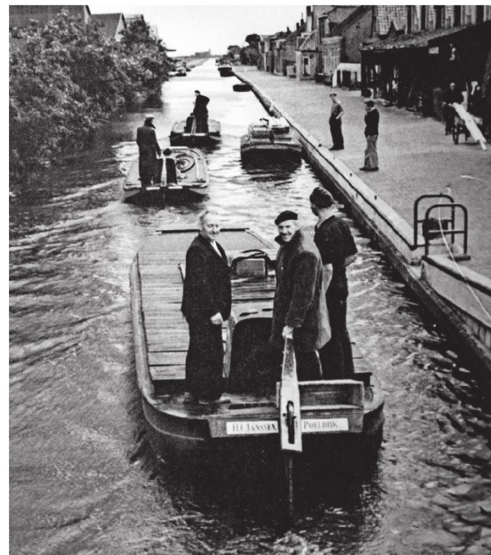
▲ Veel schippers overleden relatief jong. „Ze hadden zich letterlijk dood gewerkt.” ARCHIEFFOTO