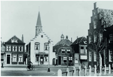
De Joodse slager Van Teijn was gevestigd in het witte pand aan het Naaldwijkse Wilhelminaplein.